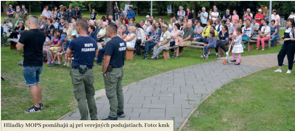
Hliadky MOPS pomáhajú aj pri verejných podujatiach.

Program Miestnej občianskej poriadkovej služby (MOPS), v minulosti známy aj ako program občianskych či rómskych hliadok, sa končí v júni tohto roka. Doposiaľ nezodpovedanou otázkou ostáva, či bude mať pokračovanie, prípadne v akej forme. Vo Filákovke je tak neistá budúcnosť desiatich zamestnancov hliadok, na celom Slovensku však môžu o prácu prísť stovky ľudí.